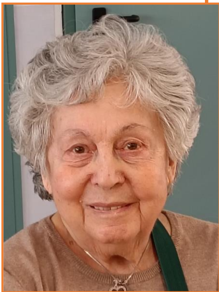
AURELIA 06 MAR