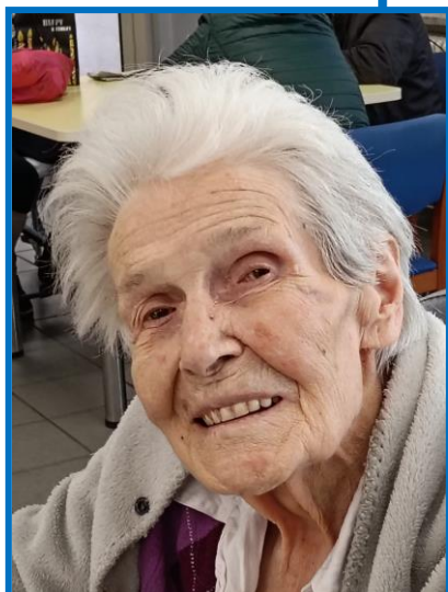
GEMMA 09 MAR ANNI 94