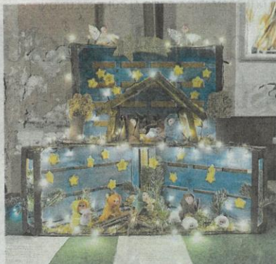
Tante stelle in cielo per la scuola d'infanzia «Alciati»