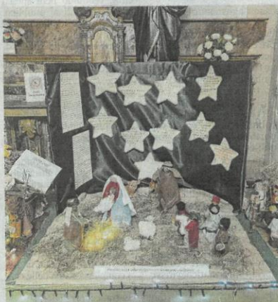
Fuori concorso il presepe degli ospiti della casa di riposo