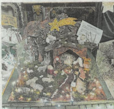
La capanna delle scuole d'infanzia «Colloidi»