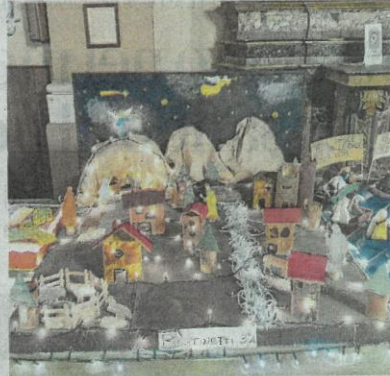
Il presepe realizzato dalla classe 3A della scuola «Bertinetti»