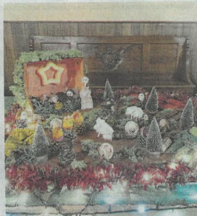
Alberelli e lucine per la scuola d'infanzia «Mora»